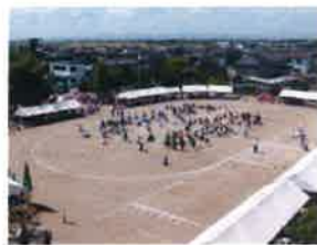
震災後の様子（2009年撮影）