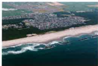
震災前の荒浜地区（2007年撮影）

The Arahama Area is located on the Pacific coastline approximately 10km away from the center of Sendai City. Approximately 800 households and about 2,200 people have settled in the area around the historical Teizan Canal which runs along the coastline. Arahama Elementary School was established in 1873, is located about 700m inland from the shoreline, and had 91 students attending it before the disaster.