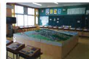
【展示室】荒浜の歴史と文化 荒浜小学校の思い出