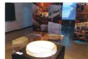
【展示室】3.11 荒浜の記憶

Those who visit Arahama Elementary School will be able to learn about the importance of preparing for disasters by looking at photos and videos from the span of time from when the earthquake happened, the following evacuation, the extent of the tsunami itself, and up until the evacuees were rescued. In addition, the Arahama area's culture and history, and memories that people have about Arahama Elementary School will also be displayed.